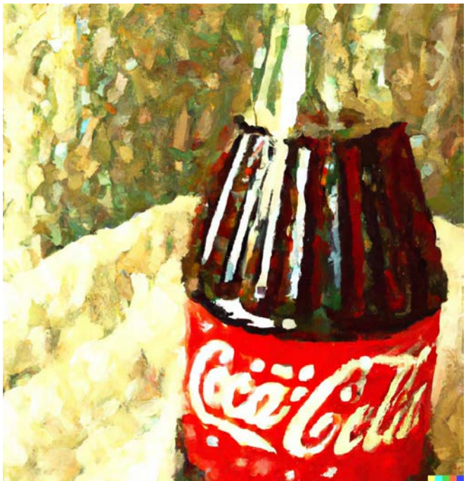
Prompt: „a van gogh style painting of a coca cola bottle“

Soweit es sich um eine bekannte Marke handelt, ist fraglich, ob eine solche Integration von bekannten Marken in ein KI-Bild einen Verstoß gegen die Rechte des Markeninhabers darstellt (bei nicht bekannten Marken wird in der Regel eine Ähnlichkeit der Waren- und Dienstleistungsklasse zu verneinen sein). Nach § 14 Abs. 2 Nr. 3 MarkenG gilt ein Bekanntheitsschutz, welcher eine Ausnutzung oder Beeinträchtigung einer im Inland bekannten Marke ohne rechtfertigenden Grund in unlauterer Weise untersagt.