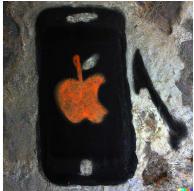
Prompt: „a prehistoric cave painting of an apple iPhone“

DALL-E verarbeitet auch Prompts, welche Markenbezeichnungen oder Darstellungen enthalten. Denkbar sind sowohl Wortmarken, Bildmarken (zu welchen auch Portraits zählen können 90 ) als auch Wort-Bild-Marken oder 3D-Marken. Beispiel-Prompts zeigen „a prehistoric cave painting of an apple iphone“ sowie „a van gogh style painting of a coca cola bottle“.